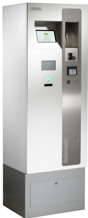
Vorderansicht Kasse Front view cashier